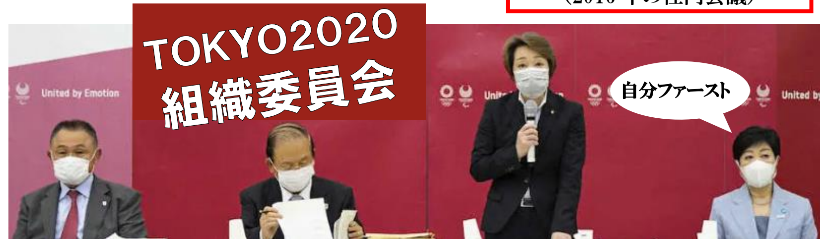
山下泰裕 組織委 副会長 JOC 会長 武藤敏郎 組織委 事務局 長 財務省 事務次官 橋本聖子 組織委 会長 自民党 参院議員 小池百合子 TOKYO 都知事 (組織委には副知事を派遣)