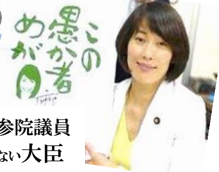
丸川珠代 自民党参院議員 五輪なんにも担当してない大臣