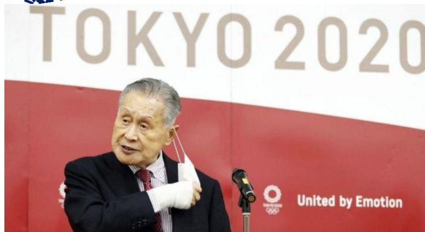
森喜朗 TOKYO2020 組織委員会 会長 自民党総裁(第19代)/内閣総理大臣(85・86代)

電通の of the Dentsu 電通による by the Dentsu 電通のための for the Dentsu